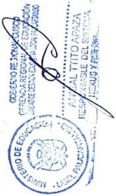
MODELO DE FOLIACION