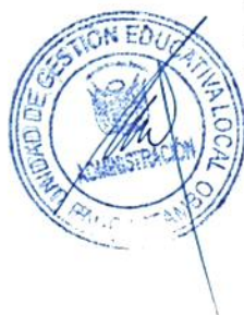
MODELO DE FOLIACION