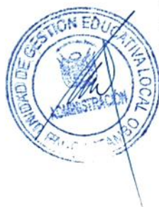
MODELO DE FOLIACION