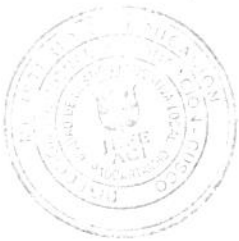
MODELO DE FOLIACION